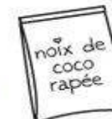
noix de coco rapée