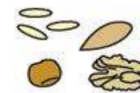
Fruits secs oléagineux